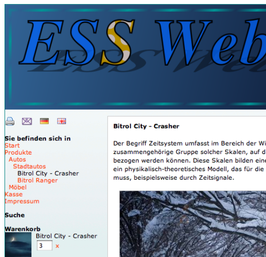
ESS Web Shop, sowohl vm Layout als auch von der Funktionalität, z.B. Flash, komplett individualisierbar

ESS ist die modern Unternehmenssoftware weil: